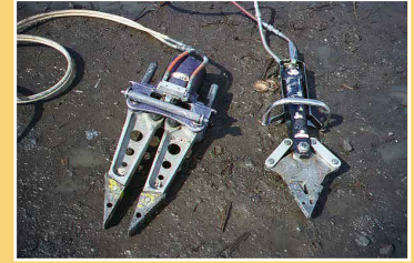
Nuevo hospital para Loreto equipo de “mandíbulas de la vida”

To provide you with some highlights of how we have spent the funds entrusted to us, below we set forth just a few examples of our spending on health, education and the environment. To address emergency medical needs, we contributed to building the new hospital for Loreto as well as to building an ambulance shade shelter. We also provided funding for the fire department to obtain “jaws of life” equipment and training, as well as for ambulance maintenance. The “jaws of life” has already been instrumental in life saving rescues on the highway near Loreto. In 2006, when Hurricane John ravaged the area, we paid for all the fuel for all the volunteer helicopter pilots who evacuated the people and brought in relief supplies to those isolated in the mountains. Our efforts to improve the health of the people of Loreto also included support for a residential drug and alcohol rehabilitation facility.