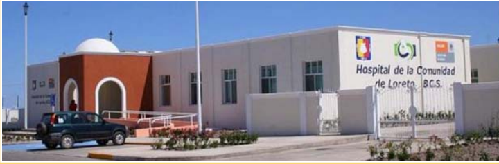
New hospital and “jaws of life” equipment